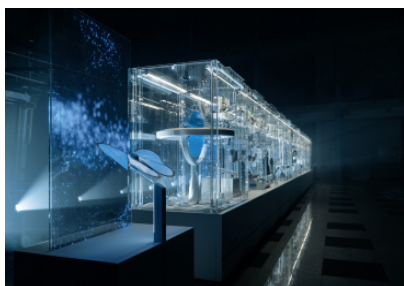
Festo Incredible Machine_dark Festo Incredible Machine